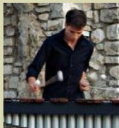
Chorando Brazil al Salieri