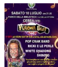
Il poster dell'evento