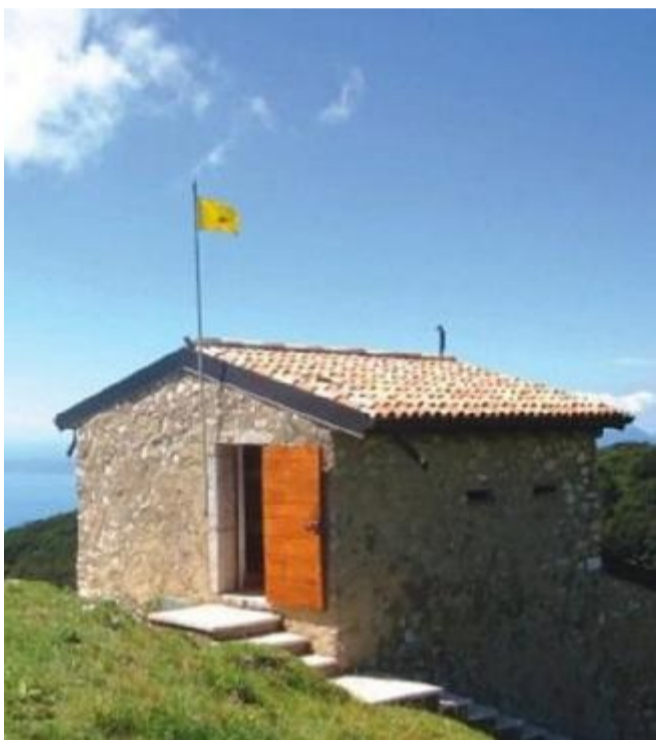
Malga Colonei di Pesina, dove suonerà il Wood Quintet

DOMENICA 5 LUGLIO , alle 18, «Baldo in Musica» scenderà nella chiesetta di San Michele di Gaium, in comune di Rivoli, per il concerto della Big band Ritmo sinfonica Città di Verona, ensemble come Banda Cit-