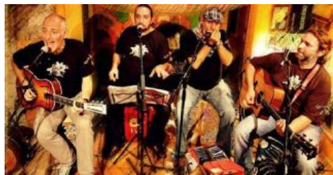
Il Tea Spoon Quartet sulla copertina del disco «Aged 10 Years»