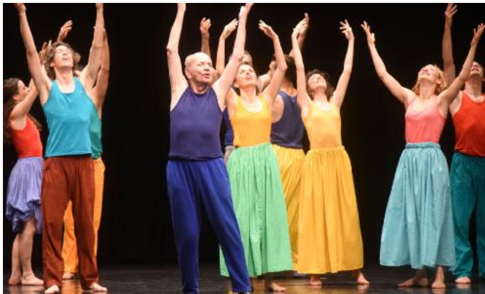
Lindsay Kemp con gli allievi del masterclass al Ristori

«Ogni ballo è un mondo» per Kemp, che sul palco ha fatto volteggiare un universo colorato e gioioso sulle note delle musiche più svariate, dai valzer alla musica classica, fino al folk. Iniziando dalla divertente La cucaracha e imprimendo fin da subito un taglio ironico ai quadri danzati che ha mantenuto per tutta la prima parte introduttiva. La seconda parte è stata poi dedicata a un vero e proprio