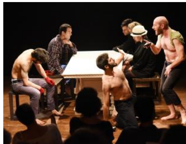
«I due gentiluomini di Verona» del laboratorio di Sepe

È stato portato in scena sul palco del Teatro Laboratorio all'Arsenale, l'esito del laboratorio di alta formazione diretto da Pierpaolo Sepe sulla commedia di Shakespeare I due gentiluomini di Verona . «Un evento eccezionale» ci ha spiegato il regista napoletano al termine dell'esibizione, «perché solitamente i laboratori rimangono a porte chiuse mentre in questo caso i ragazzi hanno dovuto mostrarsi e fare i conti con il percorso seguito». Sepe ha anche detto: «Non sono partito con in mente un progetto delineato e non l'ho chiaro tuttora. Ci siamo focalizzati