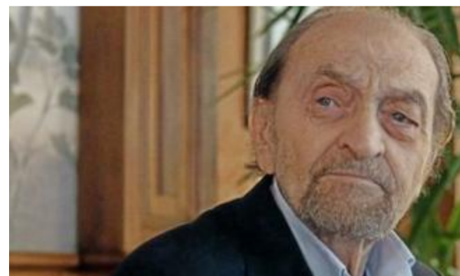
Sergio Fiorentini. Si è spento cinque mesi fa all'età di 80 anni

Una bella occasione per vedere l'ultima interpretazione del grande attore (e doppiatore) Sergio Fiorentini, protagonista assoluto della pellicola, spentosi lo scorso 11 dicembre all'età di 80 anni. Nel film interpreta Matteo, un uomo di 75 anni che decide di farla finita in grande stile, invitando i parenti a una festa per il suo ultimo giorno. Impresa che si rivelerà difficile, tra affascinanti imprenditrici di agenzie