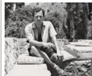
Patrick Leigh Fermor